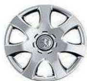
Стальной диск R14 с колпаком