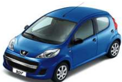
Голубой металлик LXM0