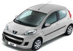
Серебристый металлик 9BM0