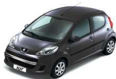
Темно-серый металлик 9AM0