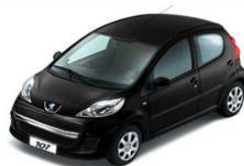
Черный металлик XZM0