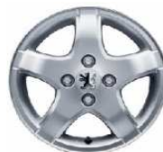
Легкосплавный диск R14